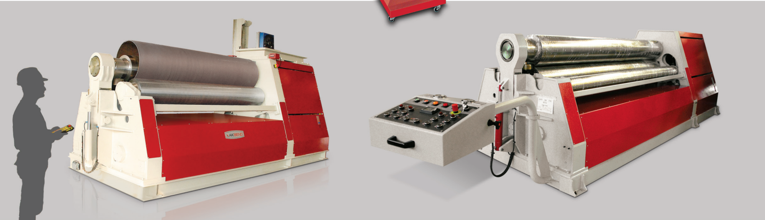
AHK-30/28 3 Rolls Hydraulic Plate Bending Machine (with optional Wireless remote pendant control)