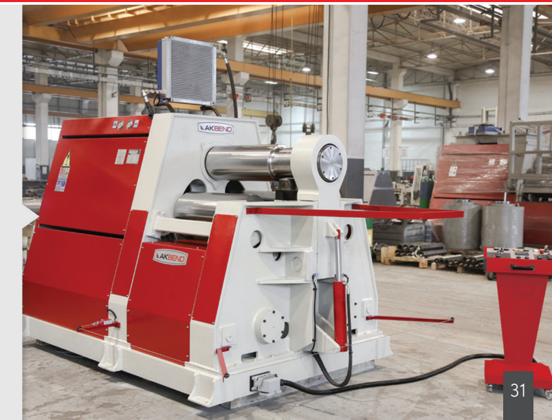
İsteğe bağlı üretilebilen çeşitli boy ve çalışma pozisyonlarında makineler

• Data indicated above are based on steel with yield point 240 N/mm • For cone bending, all bending values must be reduced %50. • All specifications are subject to change without notice.