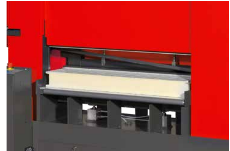
Base di taglio pneumatica – Pneumatic cutting base

Twin-column semiautomatic band saw machine with bow movement on linear ball bearing guides, hydraulic controlled working downfeed and vice closure at pneumatic control. The 125 SA DV is equipped with 10° inclined bow, cutting base movement at pneumatic control, blade dry cooling device and movable bladeguide block that, thanks to its automatic positioning during the cutting process, grants accurate cutting precision and low acoustic noise level.