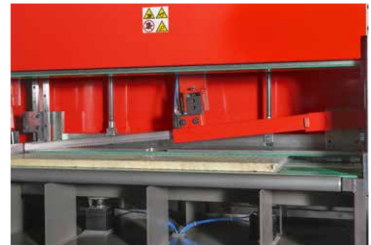
Pattino guidalama mobile – Movable blade guide