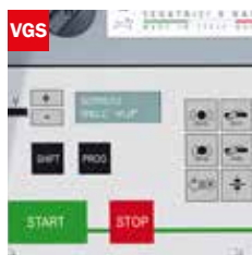
Visualizzatore gradi angolo di taglio Cutting angle display

Per collegare la macchina alle rulliere sono necessarie delle piastre di collegamento da richiedere in fase di ordine To connect the roller tracks to the machine are required connection plates on request