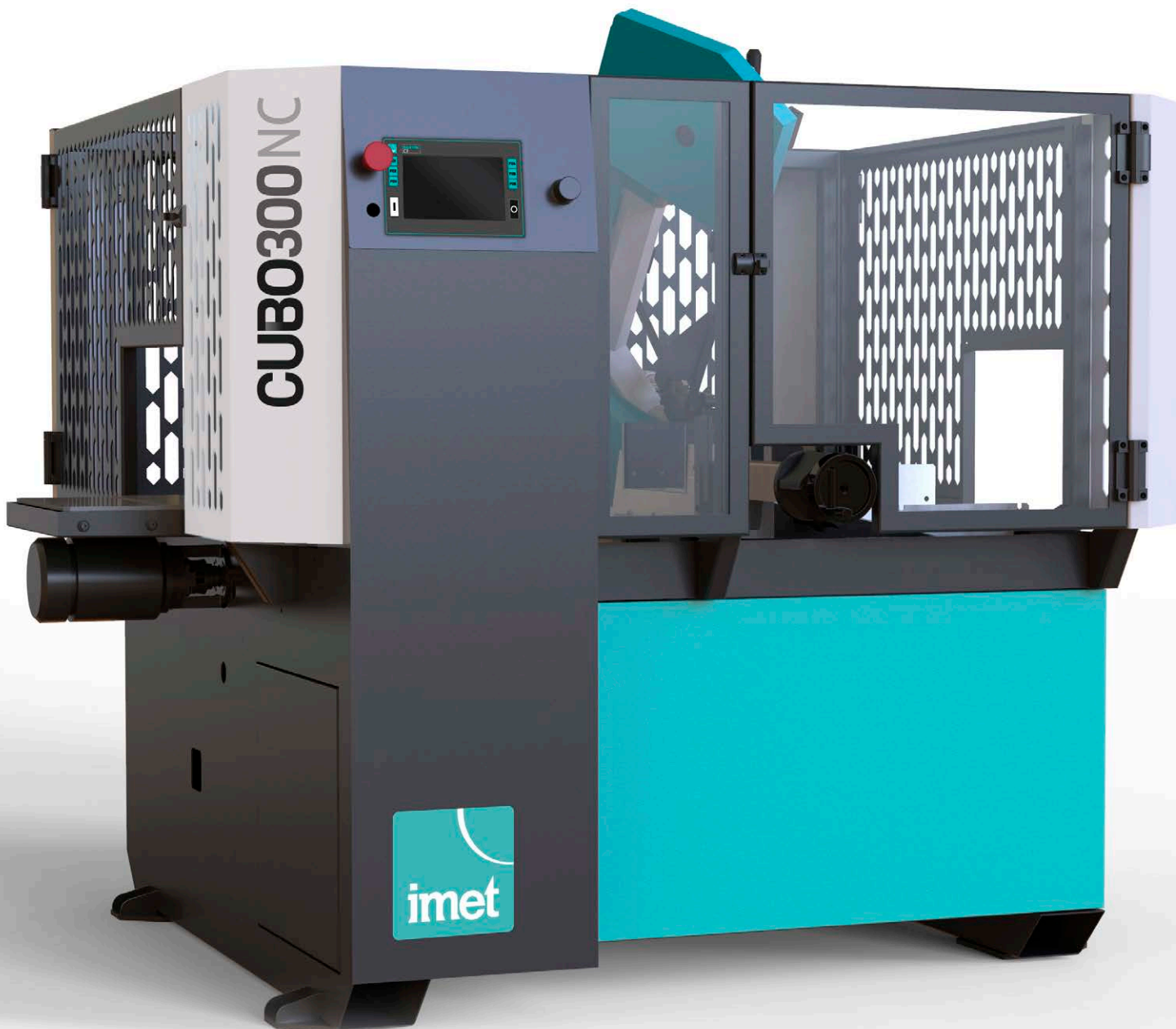
CUBO 300 NC flat