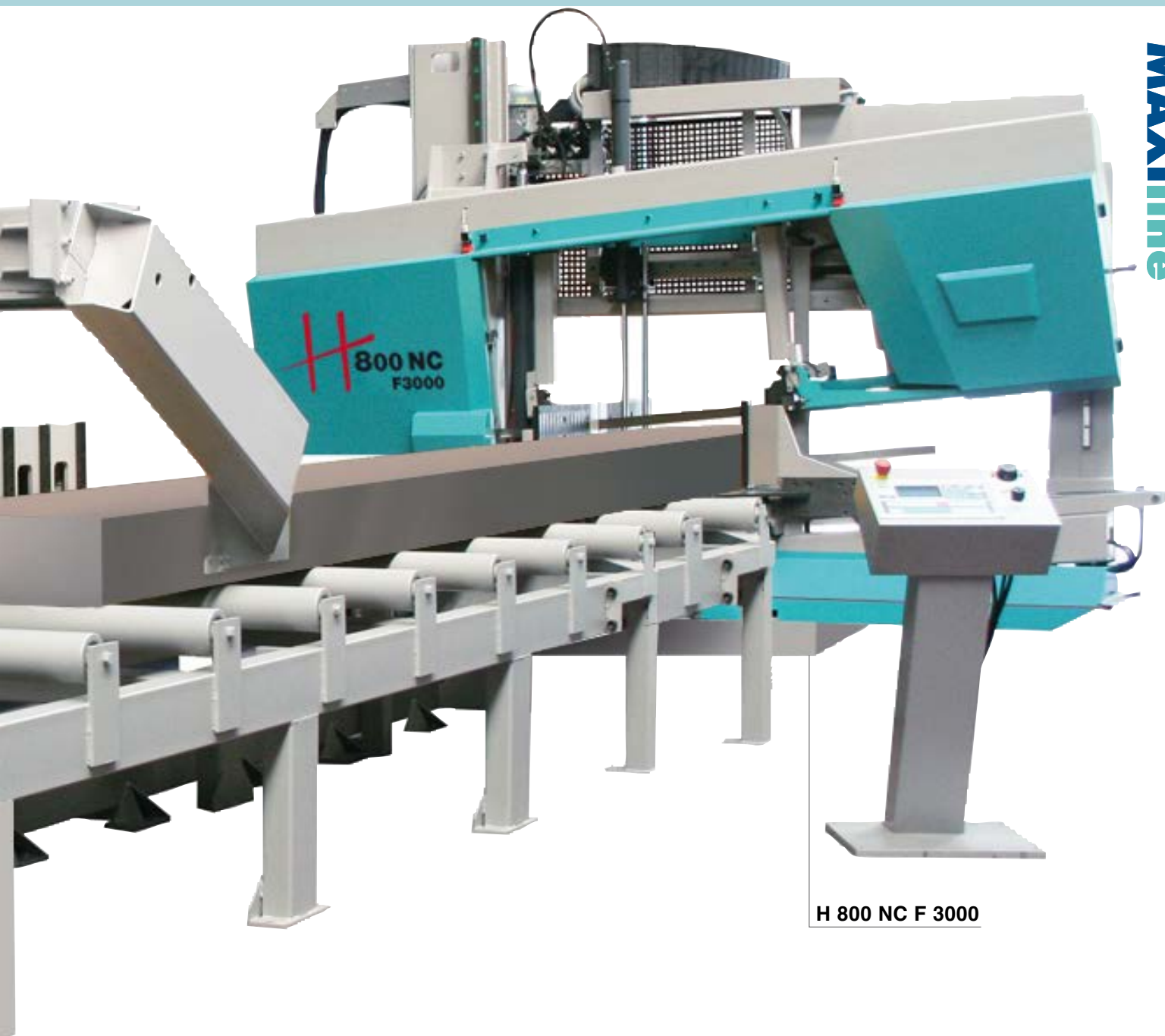
H 800 NC F 3000