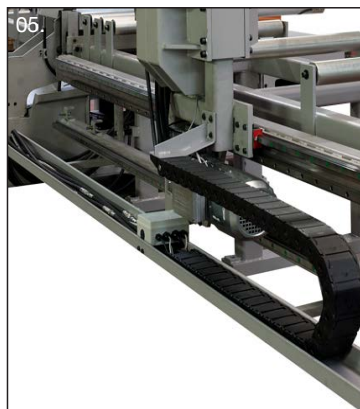
H 700 dettaglio carro avanzatore / H 700 feeder detail