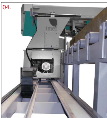
H 800 - H1200 dettaglio carro avanzatore / H 800 - H 1200 feeder detail